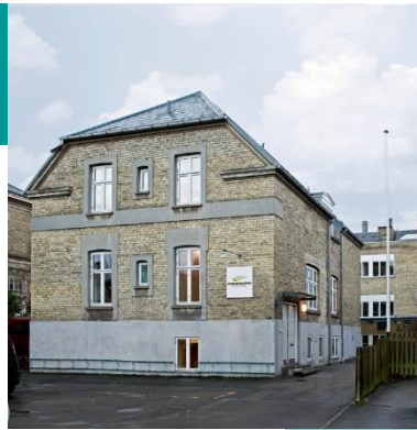
Design: Westring kbh

Kursustrappen er en selvejende institution på Frederiksberg. Vi arbejder med mennesker og læring.